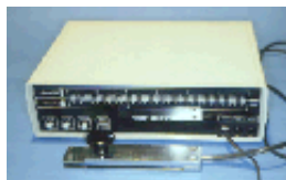
Abb.2 Abbildung der Federwaage, mit deren Hilfe der Widerstand gegen auf die Lippen ausgeübte Zugkräfte quantitativ festgestellt werden konnten.

Abb.1 Das Bild zeigt den Myoscanner, eine Vorrichtung zur Ermittlung des Lippendrucks bei geschlossenen Lippen.